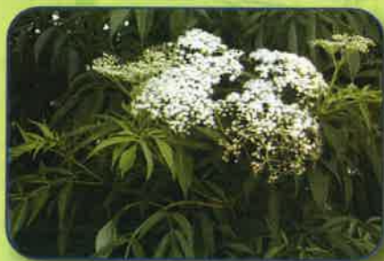
Sureau du Canada